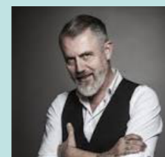
par Alain Guyard, Philosophe