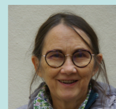
par Marielle Lachenal, Parent, Formatrice CAA